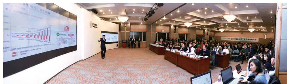
案例大赛决赛现场

清华大学工商管理案例大赛是清华大学的传统赛事之一，由清华经管学院 MBA 教育中心主办、清华经管中国工商管理案例中心全程提供学术支持。始于 2005 年，至今已经成功举办 13 届。多年来，案例大赛不断创新，积极探索与企业真实管理问题的有效结合，以打造全新的实践学习模式和校企合作模式，在共享教育资源的同时，实现产学研一体化。从 2016 年开始，大赛同期开展“管理案例研究实践”课程，进一步推动教学指导和实践学习相结合、参访分享与提问探究相结合。以往参加的企业有伊利、百度、立信、瑞士再保险、深发展、金蝶软件等。