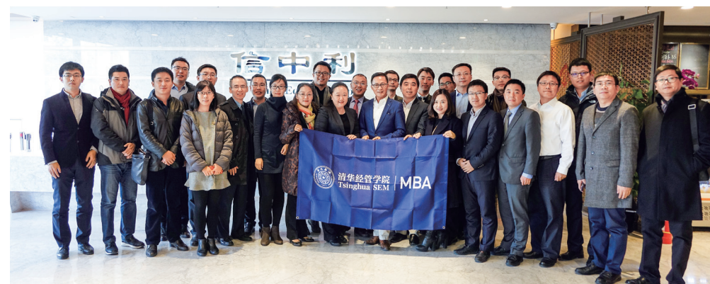
清华 MBA 移动课堂：走进信中利

“清华 MBA 企业移动课堂”活动将清华 MBA 的课堂从校园移至各省市地区甚至海外，通过邀请政届领袖、知名教授、优秀企业家在当地给 MBA 学生授课，让他们深入了解当地经济发展状况以及企业的成功之道，拓展视野，增长见识。同时，也让当地政府部门、企业管理人员、各年级学院校友共同参与清华 MBA 课堂学习，加深交流与合作。以往合作企业包括安永公司、信中利集团、启迪集团、京东、华夏幸福等。