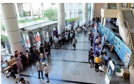
创业大赛“创业相亲会”现场

清华 MBA 创业大赛是 MBA 新生入学前、在校生在校期间可以参与的一场赛事。该赛事由清华经管学院 MBA 教育中心和清华 x-lab 联合主办。2015 年为首届清华 MBA 创业大赛，目前已成功举办 3 届。大赛希望通过实践学习的方式培养 MBA 同学的创新精神和企业家精神，为清华 MBA 同学创业提供平台和资源支持。以往合作机构有启迪之星、联想之星、百度、中关村天使投资协会、问卷网等。