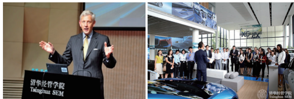
麦肯锡董事长兼全球总裁帕达民先生开讲《全球领导力》课程 《由宝马公司看世界汽车产业》课程师生在宝马公司参观学习

行业课程是学院与某一行业的知名企业合作开设的课程，由该企业高管结合真实案例，为清华 MBA 学生讲授公司实际经营管理方面的内容。《“洞悉支柱产业”系列课程：由宝马公司看世界汽车产业》、《麦肯锡课程：全球领导力》、《“洞悉支柱产业”系列课程：中国房地产业》就是目前已开设此类成功课程。课程由学院一位教授主导，与合作企业共同设计教学大纲，通常为 2 学分，8-10 次课程。在确定各课程的主题后，邀请企业高管分别担任授课嘉宾。