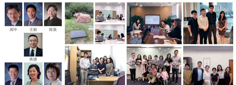
项目指导老师 实践项目回顾

整合实践项目(Integrated Practical Projects,简称 IPP),始于 2009 年,是清华 MBA 师生团队(3-6 人)为企业管理问题提供诊断与咨询方案的实践学习项目。作为新版 MBA 课程体系中的“体验式学习”的重要模块，整合实践项目要求学生在教师的指导下，以团队的方式演练真实项目，深入企业进行实地调研，完成课程报告，在课程汇报时接受教师和企业管理层的评价。目前，整合实践项目有《信息时代的管理创新》、《商业计划的设计与开发》、《战略》、《营销规划》、《组织行为与人力资源管理》、《金融咨询》等方向。合作企业中既有中国电信、中国南车、首都机场、中冶海外等大型国企，也有英国电信、正大集团、合益集团等知名的国际企业，有探路者、立信集团、搜房网等快速发展的民营企业，也有格蕾丝儿童基金会、慈济之家等公益组织。清华整合实践项目已经成功举办 9 年，有 1247 名学生参加，涉及近 203 家企业的 314 个项目，提供的咨询方案得到企业的一致好评。