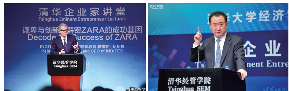
INDITEX 集团主席、首席执行官帕布罗·伊斯拉（Pablo Isla）做客清华企业家讲堂 大连万达集团股份有限公司董事长王健林做客清华企业家讲堂

清华企业家讲堂始于 2011 年，邀请富有远见卓识和卓越领导力的商业领袖为主讲嘉宾，与学生分享创业、管理经验以及对创业与人生的思考，帮助师生近距离了解中国民营企业、改制的国有企业以及跨国公司的企业家和商业领袖。并希望通过这个讲堂，加深清华学子对企业家的理解，同时激发学生自身的企业家精神。